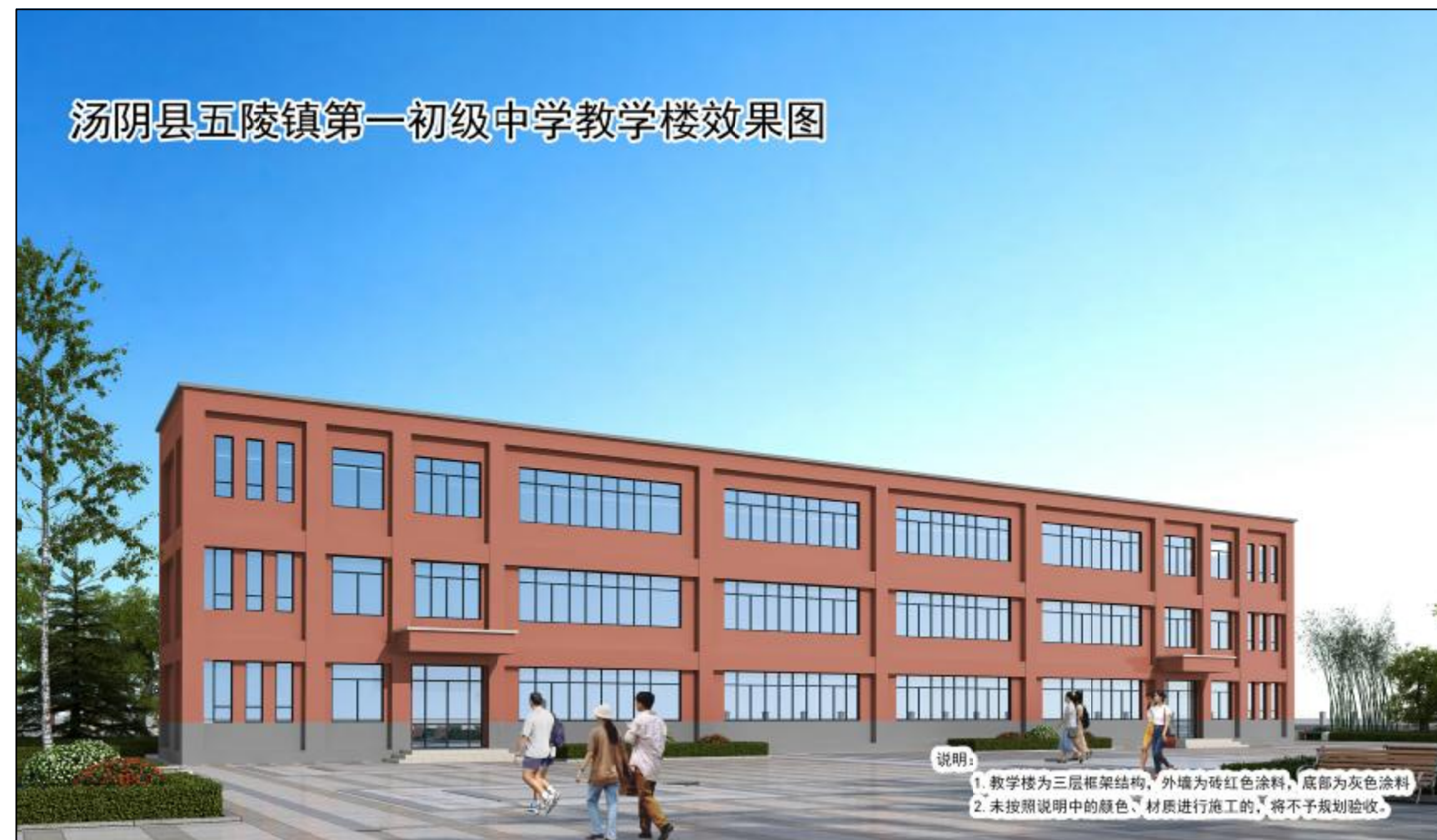
汤阴县五陵镇第一初级中学教学楼效果图

说明： 1. 教学楼为三层框架结构，外墙为砖红色涂料，底部为灰色涂料 2. 未按照说明中的颜色、材质进行施工的，将不予验收。