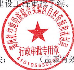
核准规划建设用地表