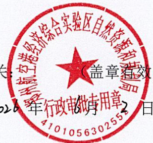
核准规划建设用地表