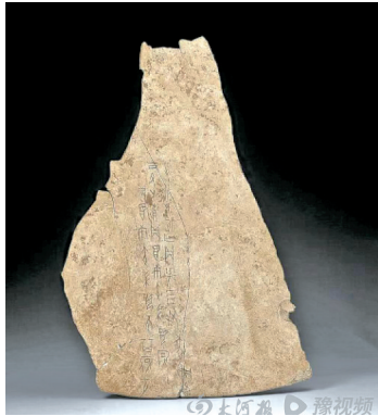
妇好娩卜骨（妇好生孩子会难产吗？）