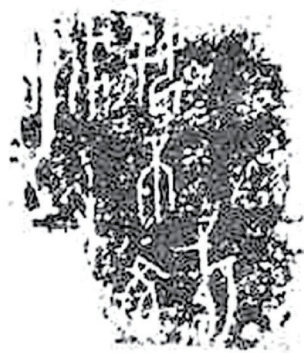
貞王夢帝好不佳眚。