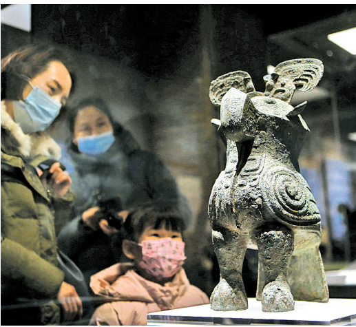
河南博物院展品妇好鸛尊