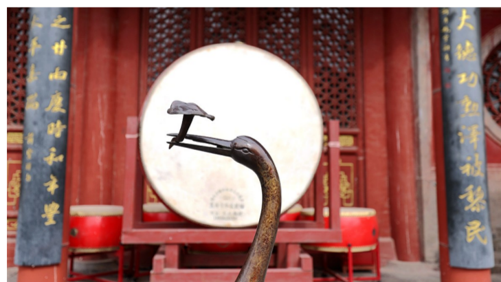
中大殿前，仙鹤造型的器物静卧立。

在“敕建嘉应观”匾额下穿过山门，迎面是方砖铺成的甬道，不宽，却是嘉应观最核心的中轴线，方砖斑斑驳驳，蔓延的纹路漫着历史的风霜，见证着嘉应观从清初走到现代。观内隐隐传来黄河泥坝的哨声，悠悠扬扬，仿佛述说着黄河过去的故事、未来的愿景。