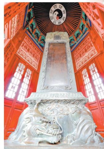
御碑亭内矗立着嘉应观的镇观之宝大铜碑，铜碑为铁胎铜面，碑周精雕24条龙。