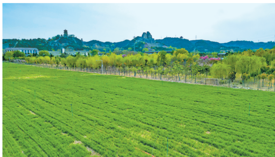
▲黄河文化公园里，炎黄二帝像凝视下的黄河岸边麦田（3月30日摄）。