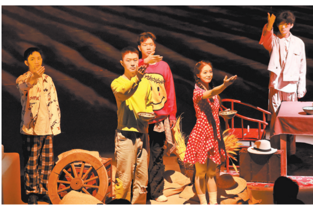
只有河南·戏剧幻城新剧《麦子啊麦子》（4月3日摄）。

《视觉周刊》是河南日报社与河南省摄影家协会联合打造的新媒体产品，每周五发布。周刊旨在用精品影像记录河南发展的时代缩影，长期面向广大摄影爱好者征稿，稿件须为一周内拍摄，附时间、地点、作者等简短说明。 投稿邮箱：sybhnrb@163.com