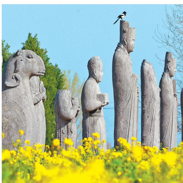
宋陵是我国现存最完整的古代陵墓造像群之一（3月25日摄）。