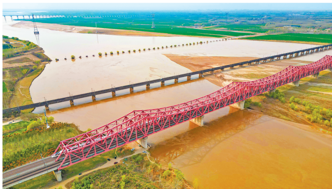
▲黄河奔流东去，高铁穿行于大河与麦田之上（3月30日摄）。