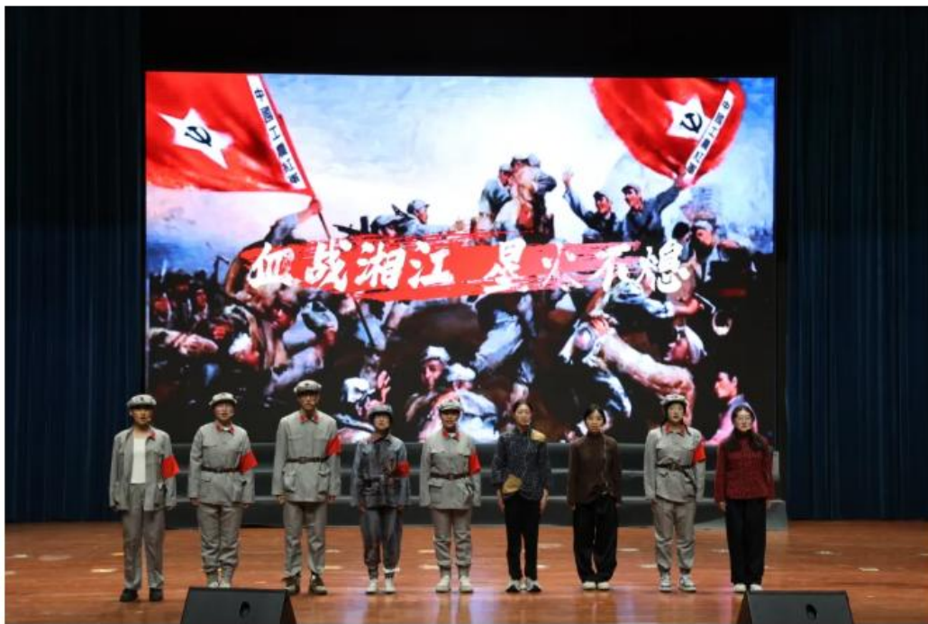
节目《血战湘江：星火不息》

由师生自编自导自演的原创节目，串联起一幅理论与实践深度融合的壮丽画卷。节目《思想的闪电》生动演绎了社会主义如何从空想走向科学，马克思、恩格斯与工人的对话穿越时空，掷地有声；节目《庶民的胜利》则将观众带回1918年的北平街头，再现了李大钊先生传播马克思主义真理、唤醒民众的澎湃激情；节目《星火征程——新时代》通过青年毛泽东、长征战士与新时代大学生的跨时空对话，完成了理想信念的青春接力，将全场气氛推向高潮……一个个精心编排的节目，既是对思政理论的生动诠释，也是学生们实践感悟的真挚表达。