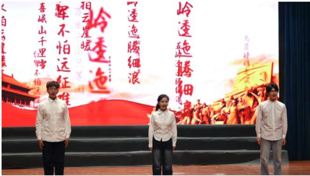
节目《星火征程——新时代》