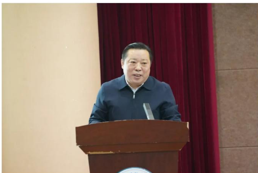
开封市委教育工委书记、市教体局党组书记、局长 蔡建春总结讲话

柯新凡作题为《大中小学思政课一体化建设的理论与实践》的专题报告，系统剖析各学段思政课教学在目标衔接、内容重复与断层、教学方法适应性等方面的核心难题，并结合大量案例，提出了具体的实践路径。