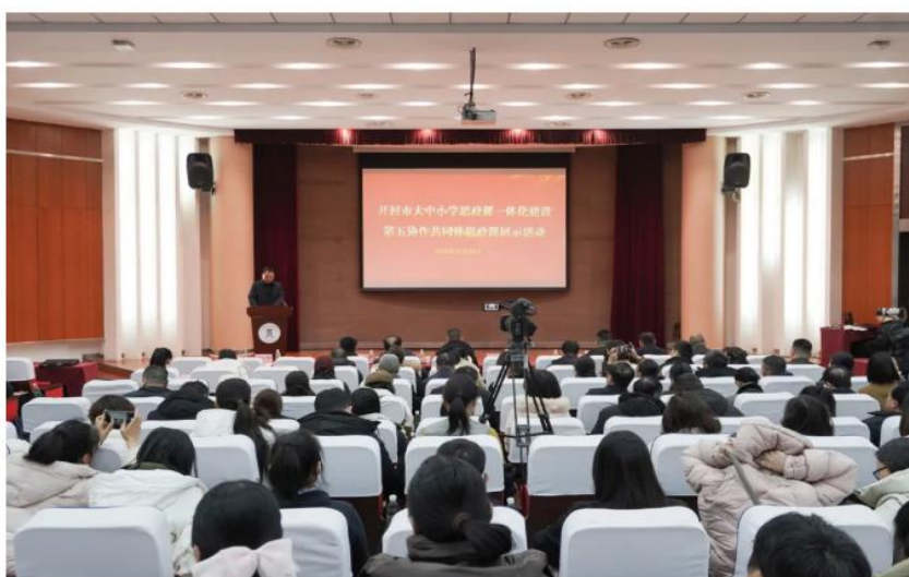
开封市大中小学思政课一体化建设 第五协作共同体思政课展示活动现场

为深入学习贯彻党的二十届四中全会精神，12月26日，河南开封科技传媒学院与开封市教育体育局联合举行 开封市大中小学思政课一体化建设第五协作共同体思政课展示活动 。