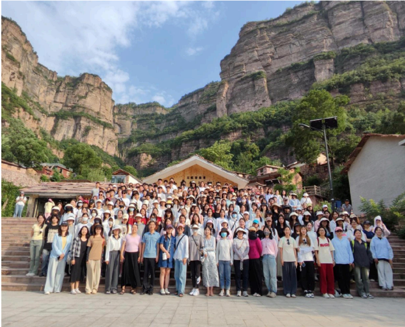
学生外出前往村落考察