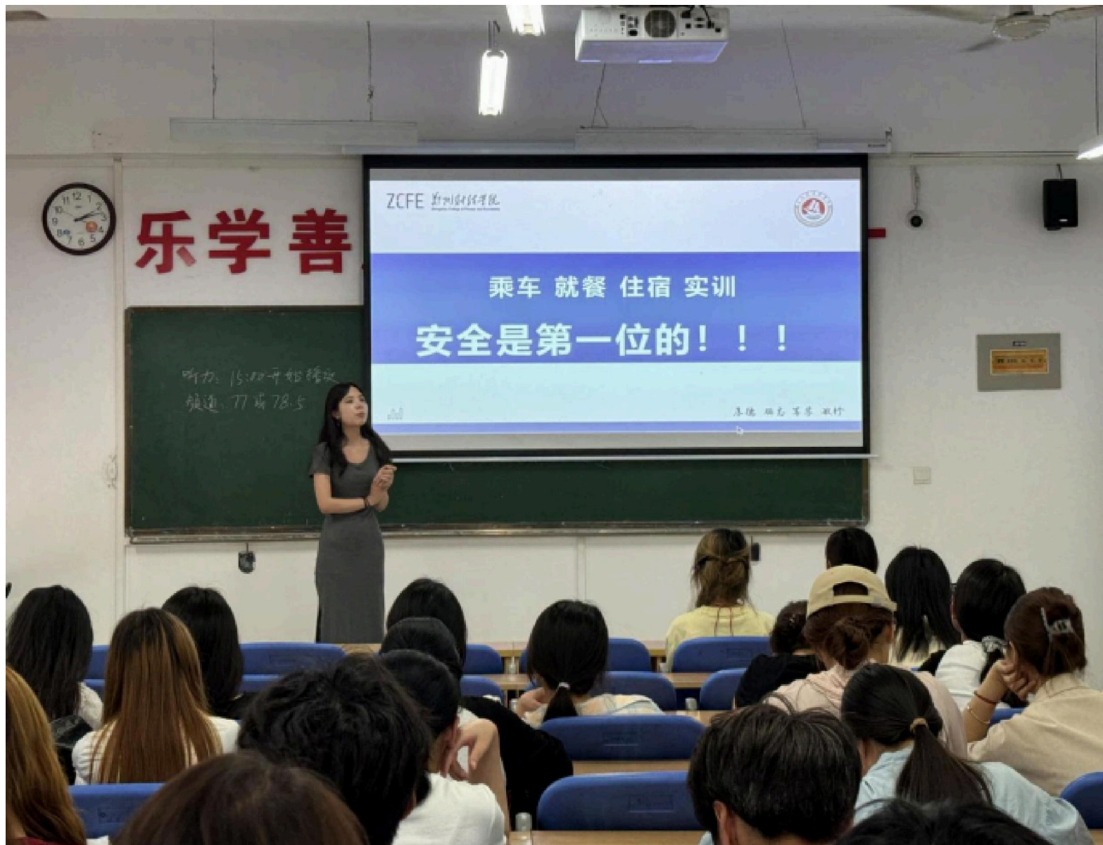
指导教师与班主任开展启动会