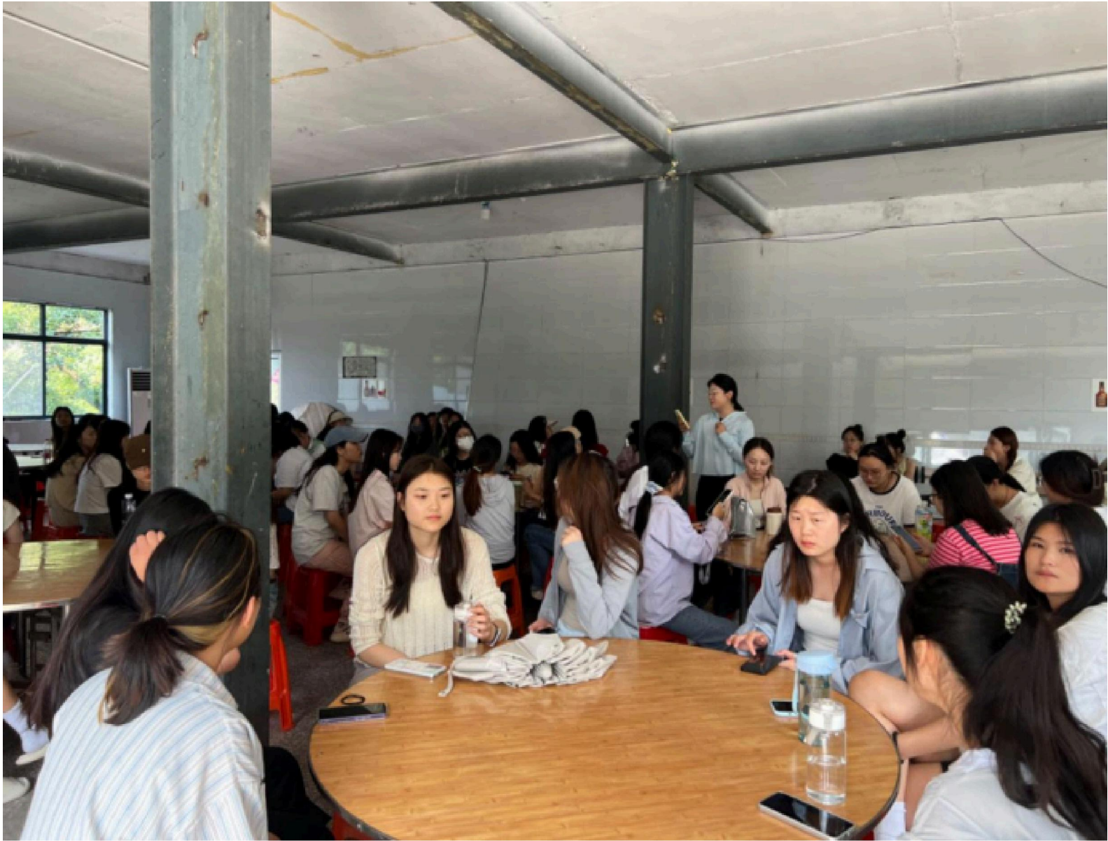
各班组织学生开展反馈会