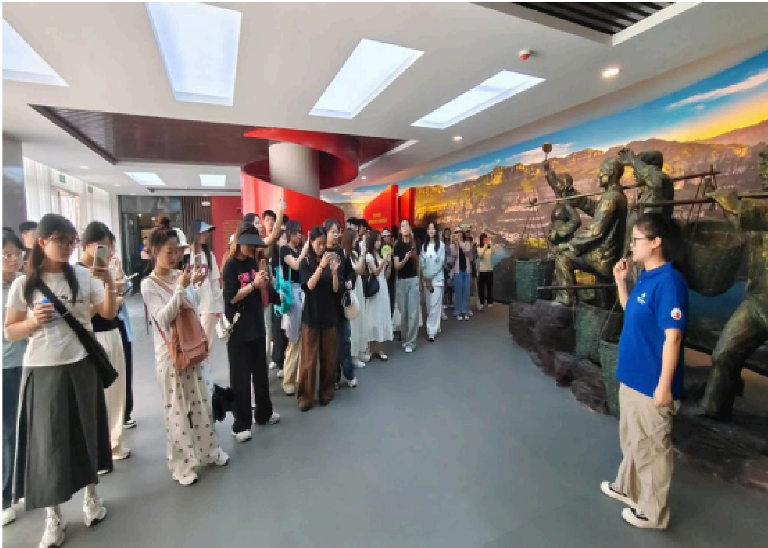
学生参观扁担精神纪念馆与谷文昌纪念馆

本次暑期小学期的项目实践课程带领学生来到林州石板岩镇，各班级学生根据课程安排，有深入当地古风村落，通过镜头记录、交流访谈、查阅资料等实地考察太行山的自然风光和人文景观特点；有参观扁担精神纪念馆与谷文昌纪念馆，用专业知识手法记录红色文化，培养家国情怀，拓宽文化视野；有考察当地文化旅游资源，通